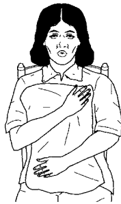
Toser y respirar profundamente